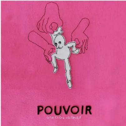
Une création de « Une Tribu Collectif »

Le Centre culturel de Libramont et le Ciep Luxembourg collaborent au travers de « Pouvoir », une création théâtrale poétique et jubilatoire qui questionne les notions de pouvoir, de manipulation et la place du citoyen dans les décisions publiques.